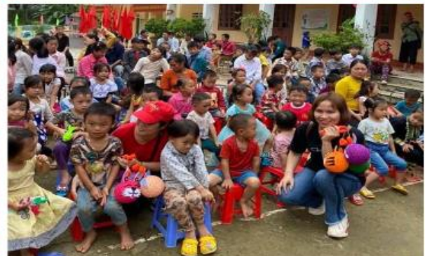
Hình ảnh: Vui trung thu của các bé Huyện Bát Xát- Tỉnh Lào Cai