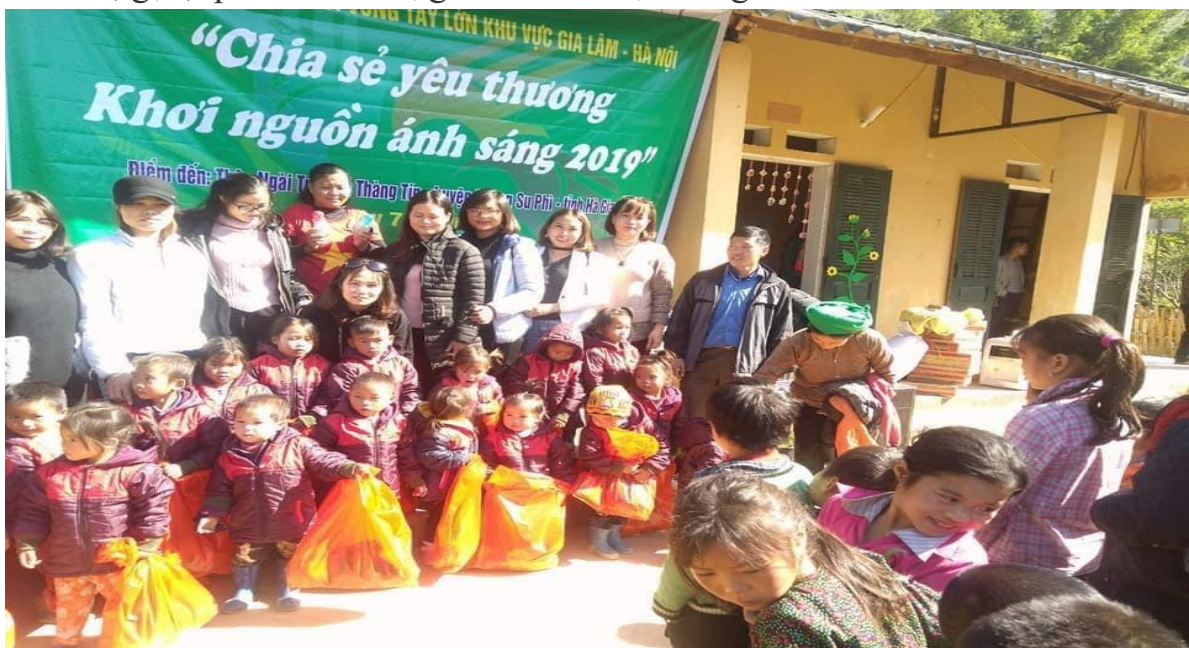
Hình ảnh: Tặng quà cho các cháu vùng cao

Ngày 7/12/2019 tại thôn Ngòi Trờ- xã Thành Tín- Huyện Hoàng Su Phì- Hà Giang. Cô cùng đoàn trong CLB đã kêu gọi và quyên góp nhiều phần quà, mì tôm, gạo, quần áo .... trị giá hơn 70 triệu đồng