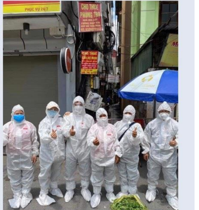
Hình ảnh: Phát rau cứu trợ miễn phí cho nhân dân trong thời kỳ dịch bệnh

Trong đợt xét nghiệm diện rộng và tiêm chủng vaccine Covid-19, với tinh thần quyết tâm cao, huyện Gia Lâm nói chung và xã Đa Tốn nói riêng sẽ tập trung mọi nguồn lực, tranh thủ từng phút, từng giờ, bằng mọi biện pháp, tận dụng thời gian vàng trong thời gian giãn cách xã hội để xét nghiệm cho người dân một cách an toàn, hiệu quả, nhằm phát hiện sớm các trường hợp F0 trong cộng đồng; kịp thời cách ly, khoanh vùng, dập dịch. Đồng thời tổ chức tiêm chủng vaccine phòng Covid-19 mũi 1 cho toàn bộ người dân từ 18 tuổi trở lên trên địa bàn xã đa tốn. Cô đã cùng đoàn thiện nguyện góp phần nhỏ nhỏ động viên tinh thần các y bác sĩ, các anh chị em tình nguyện viên, đoàn thanh niên, dân quân, cùng các chốt trực covid địa bàn xã những trai trẻ mà các cô tự làm đảm bảo an toàn sạch sẽ. Với 550 chai nước tiếp sức động viên tinh thần mọi người trong những ngày chống dịch, mong đại dịch qua mau để ổn định cuộc sống bình thường.