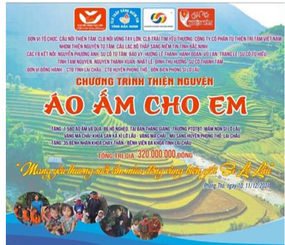
Hình ảnh: Kêu gọi các nhà hảo tâm qua các kênh thông tin

Chương trình thiện nguyện đã mang lại niềm yêu thương sưởi ấm mùa đông biên giới vào ngày 10,11/12/2021 với tổng trị giá 320 triệu đồng. Sau đây là một số hình ảnh của buổi đi thiện nguyện của đoàn: